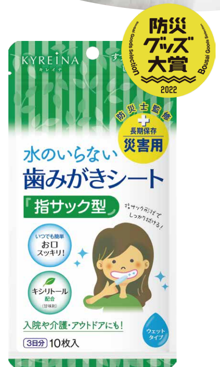
▲歯みがきシート 3日分/10枚入