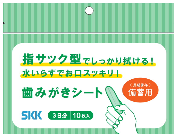
▲歯みがきシート 3日分/10枚入